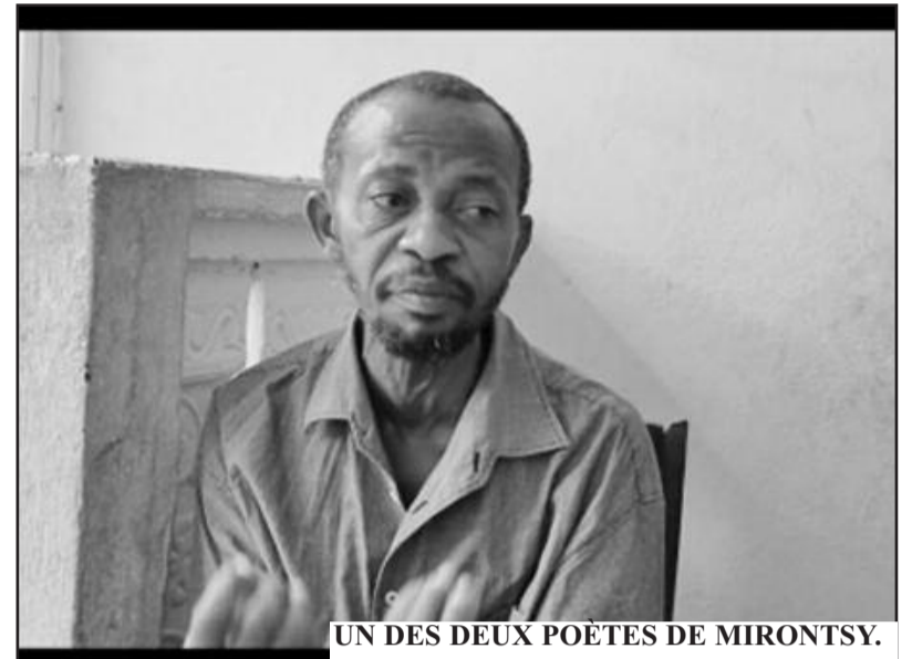
UN DES DEUX POÈTES DE MIRONTSY.

faire porter à Dieu, nous risquons de le rendre bossu. C'est une métaphore, bien sûr. Une manière de ramener l'homme à sa responsabilité. Prier, c'est honorer le Seigneur, sur un plan religieux. Dans le sens qu'on lui donne ici, prier c'est aussi questionner notre responsabilité dans cette vie. Savons-nous encore le sens de ce qui nous relie au sacré ? A-t-on conscience de cette intimité qui nous fonde ? A force de répéter une geste ramenée d'ailleurs, sans en questionner le sens, nous finissons par nous perdre ». Voulant probablement initier un débat sur la question de la perte et de la reconstruction, ce film est une