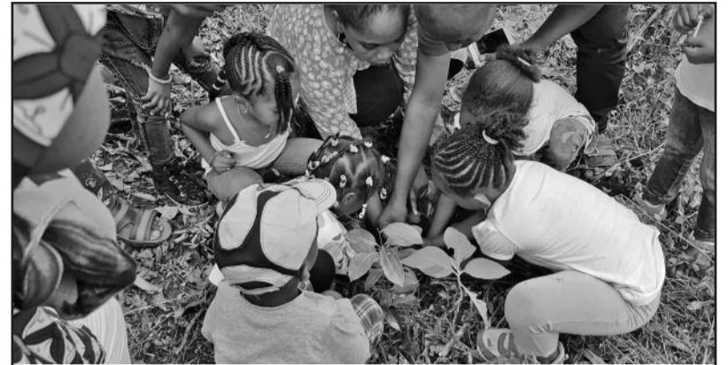
Des enfants de l'école Lalla Salma découvrent la nature