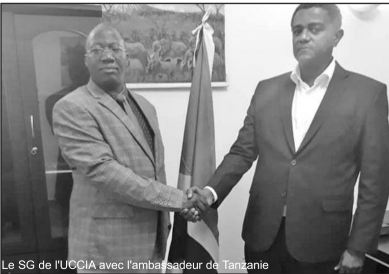
Le SG de l'UCCIA avec l'ambassadeur de Tanzanie

Le mercredi 10 Juillet, une délégation d'hommes et de femmes d'affaires tanzaniens sera à Moroni. La majorité d'entre eux opèrent dans le domaine agricole. Une très belle initiative selon le secrétaire général de l'Union des Chambres de Commerce d'Industrie et d'Agriculture (UCCIA).