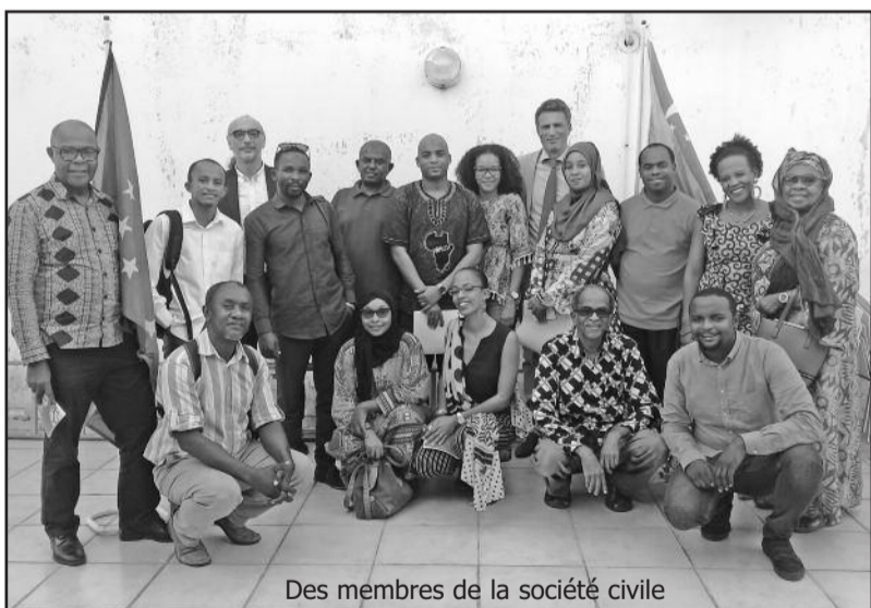
Des membres de la société civile

Porte en charge de la Coopération, a rencontré des représentants de la société civile hier, dans l'après-midi, au Bureau de l'UE à Moroni.