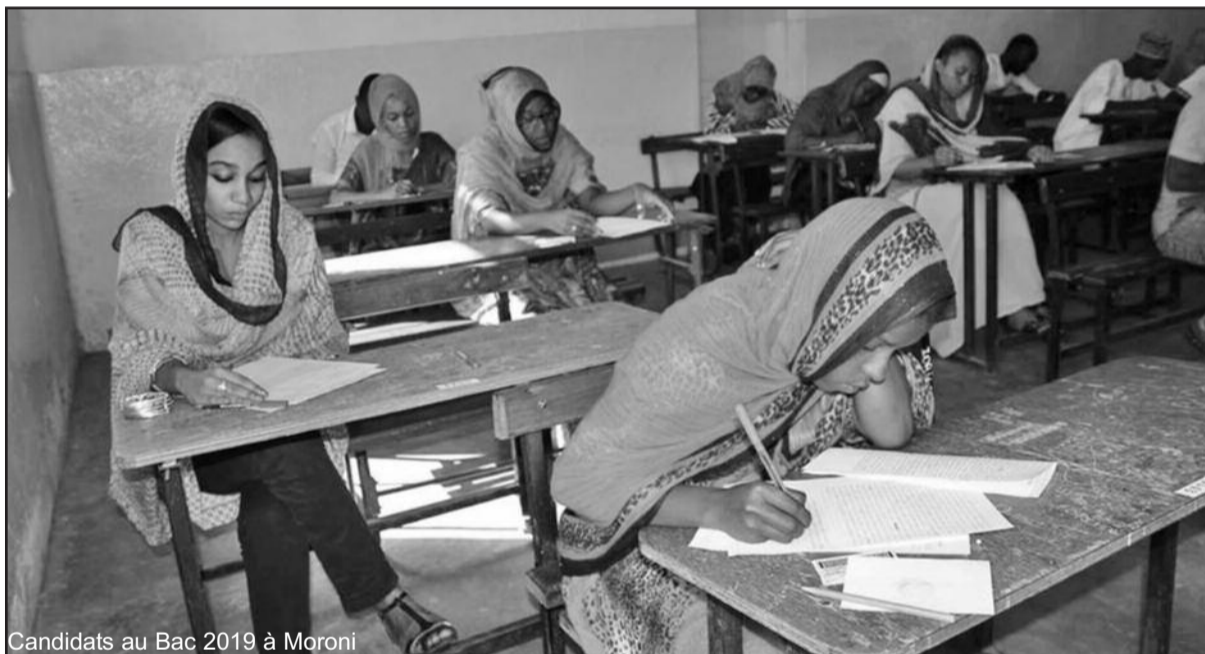
Candidats au Bac 2019 à Moroni

Les examens nationaux ont commencé depuis le 30 juin dernier avec le concours d'entrée en sixième. Hier lundi, c'était le tour du baccalauréat au niveau national et le coup d'envoi a donné avec la philosophie dans la matinée. Hormis la série A4, les autres séries ont lieu dans l'après-midi pour l'épreuve de l'Histoire-Géo. Le président du jury à Ngazidja, Abdou Satar Mitudjay explique que le baccalauréat a débuté dans un environnement serein. Les candidats et les surveillants respectent les consignes liées à cet examen national. «