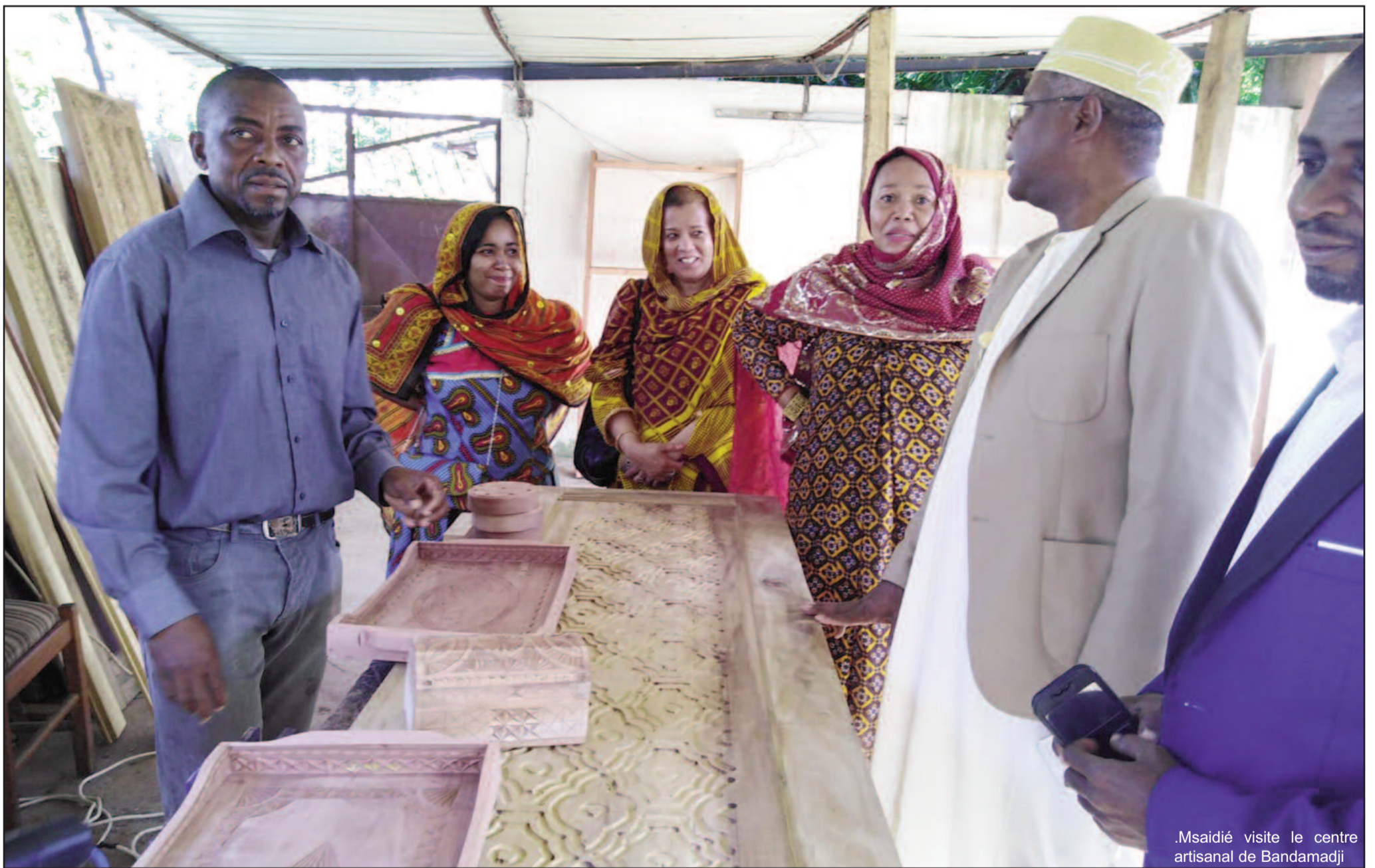
.Msaidié visite le centre artisanal de Bandamadji