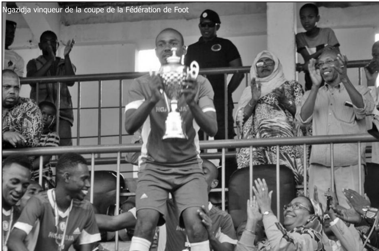
Ngazidja vainqueur de la coupe de la Fédération de Foot

Le dimanche 7 juillet 2019, les deux prétendants au titre, sélection de Ngazidja et celle de l'île de Djumbe Fatima, ont réussi à retarder l'échéance. Le jeu, bien que hachuré de temps à autre, par de coriaces chocs, était équilibré. L'arbitre, véritable usine de cartons, a maîtrisé la situation. Les buteurs du match (1-1) sont, Tchenko pour les locaux et, Guigui pour les visiteurs. Le dernier geste qui a fait la différence est apparu à la fatidique séance de tirs au but (3-